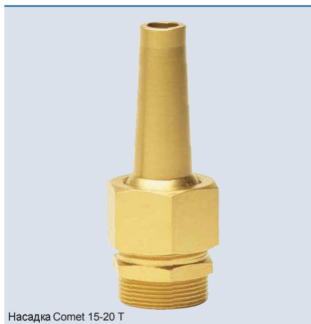
Насадка Comet 15-20 Т

Насадки Comet 10-12 Т и Comet 10-14 Т идеально сочетаются с подсветкой ProfiPlane LED 320 / DMX / 02 и ProfiRing LED 320 / DMX / 02 (стр. 94-97).